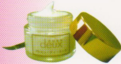
PDビューティーネック (30g) ¥3,360 (税込) (本体価格¥3,200)

首筋は第二の顔といわれ、顔より老化が隠しにくい部分です。でも毎日お手入れする顔に比べつい忘れがち、意外と目につきやすい首すじも美しくありたいものです。皮膚が柔らかく薄いうえ、寝ている時でさえ酷使されている首筋や衿元の肌を、選ばれた有効成分が活力を与え老化を防ぎます。試作と試用を重ね自信を持ってご紹介できる“首すじ専門クリーム”になりました。